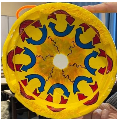
Schéma du Soleil

Durant la suite de la séance, les intervenants nous ont parlé un peu plus des étoiles et du Soleil. Les étoiles produisent leur propre lumière à la différence des planètes qui la réfléchissent. Les étoiles sont composées de gaz (majoritairement d'hydrogène et d'hélium) sous forme de plasma, un état de la matière semblable à une « soupe ». Nous avons aussi appris que les étoiles étaient des corps chauds. Pour ce qui es du Soleil, nous avons eu des infos sur son diamètre (1 300 000 km), sa température (5 500 kelvins en surface et 15 000 000 K au centre), mais également sa densité (1,3) et la distance Terre Soleil (150 000 000 km ce qui équivaut à une unité astronomique). De plus on nous a montré et expliqué un schéma du Soleil représenté sous forme de maquette ci-contre.